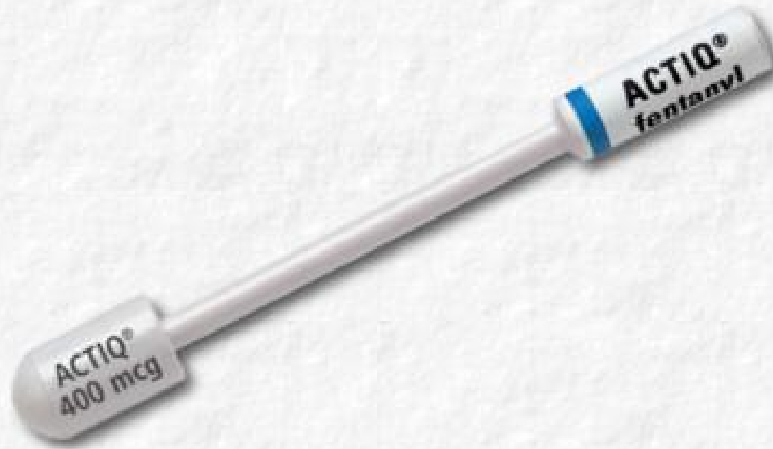
Actiq® (oral transmucosal fentanyl citrate)